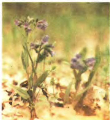
852. Медунка вузьколиста.